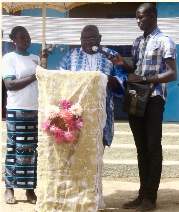
Zingan : village situé au sud-ouest du Burkina-Faso, à quelques kilomètres de la frontière avec le Ghana.