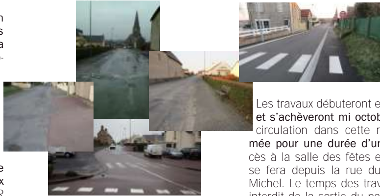
Rue de la Roseraie, Quetteville-sur-Sienne

Ce sera l'occasion également de se mettre aux normes d'accessibilité aux piétons, en aménageant un accès PMR (Personne à Mobilité Réduite) vers le lotissement de la Roseraie.